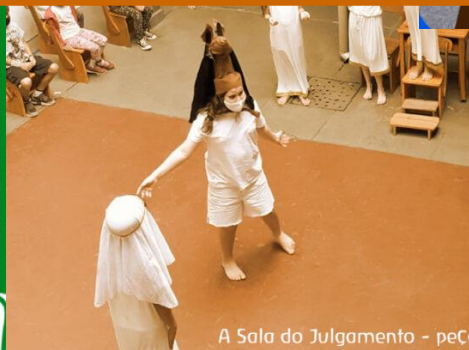
A Sala do Julgamento - peCa